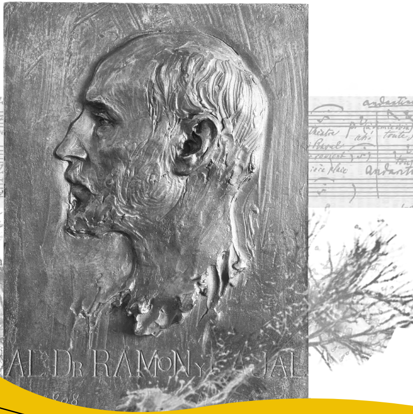
Mariano Benlliure, Santiago Ramón y Cajal. 1908. Bronce. Fundación Mariano Benlliure.